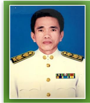
สibtารวจโทมานิง สุขสาย